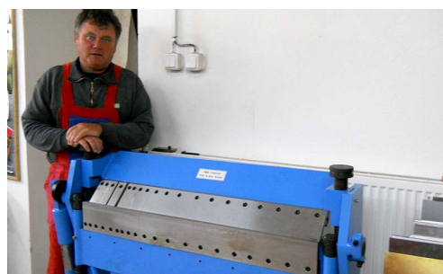
Rozšíření klempířské výroby Továrek - Bělá u Jevíčka