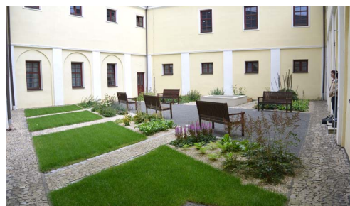
Úprava rajského dvora bývalého augustiniánského kláštera Jevíčko