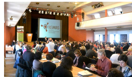
Valná hromada NS MAS ČR, Týnec nad Sázavou, 12.3.- 13.3.2014