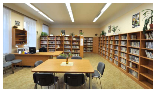
Modernizace Místní lidové knihovny Bělá u Jevíčka