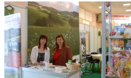
Země Živitelka, České Budějovice, 28. – 31.8.2014