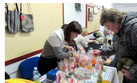
Vánoční jarmark, Jaroměřice, 29.11.2014