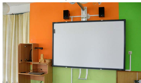
Pořízení moderní výukové techniky, MŠ Jevíčko