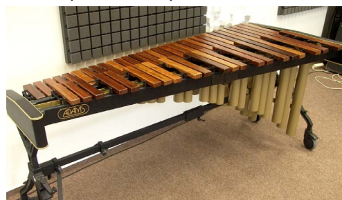
Zkušebna regionálních souborů a orchestrů v ZUŠ Jevíčko