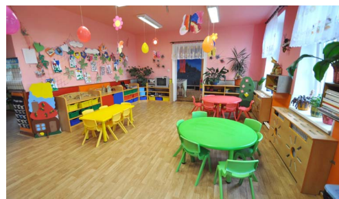
Modernizace vybavení mateřské školy Křenov