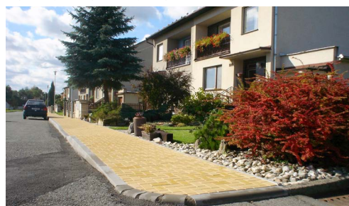
Rekonstrukce chodníku a veřejného osvětlení - Chornice - ulice Sluneční