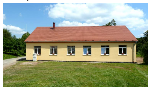
Oprava kulturního domu v Zadním Arnoštově II. etapa