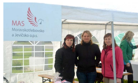
Biskupické kalíšek, 4.10.2014