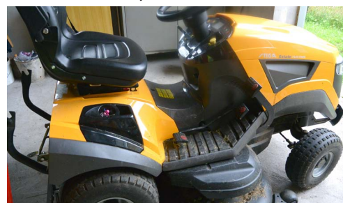
Technika na údržbu veřejných prostranství, obec Bělá u Jevíčka