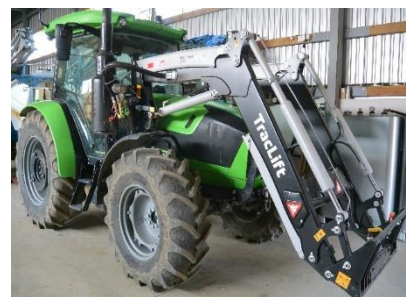
Zrealizovaný projekt „Pořízení traktoru s čelním nakladačem“

V roce 2019 bylo podáno 19 Žádostí o platbu a zároveň provedeno 19 kontrol fyzické realizace projektu ze strany RO SZIF Hradec Králové u žadatelů, u kterých byl vždy přítomen zástupce MAS. Dále zaměstnanci MAS řešili administrativní kontroly podaných žádostí o dotaci v druhé výzvě a posléze i doplnění nedostatků v rámci administrativní kontroly ze strany RO SZIF Hradec Králové s jednotlivými žadateli. Počet nových podaných žádostí o dotaci (celkem 20) a také úspěšně zrealizované projekty jsou důkazem toho, že Program rozvoje venkova a jeho dotované oblasti podpory jsou pro území přínosné a zároveň tvoří pro žadatele dobrou alternativu k tzv. „velkému„ Programu rozvoje venkova. Největší zájem žadatelů byl o pořízení techniky v zemědělství a mezi drobnými podnikateli o modernizaci strojů a zařízení. S počtem žádostí, které byly nově zaregistrovány, znamenají úkony na MAS zvýšené administrativní nároky na zaměstnance.