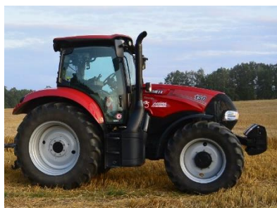
Zrealizovaný projekt „Nákup zemědělské techniky“