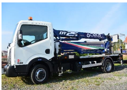
Zrealizovaný projekt „Pořízení montážní plošiny“