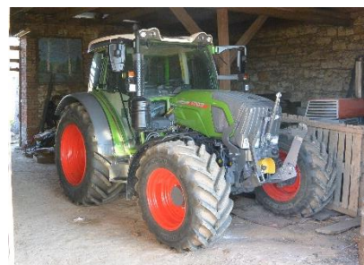
Zrealizovaný projekt „Nákup traktoru“