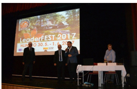
LeaderFest 2017, Hlinsko, návštěva ministra zemědělství Ing. Jurečky