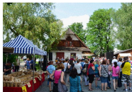
LeaderFest 2017, Hlinsko, tradiční jarmark

Během této akce jsme se, s ostatními zástupci MAS Pardubického kraje, podíleli na přípravě občerstvení a zároveň jsme nasbírali nové informace, zkušenosti a příklady dobré praxe, které využijeme dále v našem regionu a naší práci.