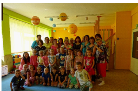
Exkurze pro pedagogy MŠ, červen 2017, MŠ Lentilka