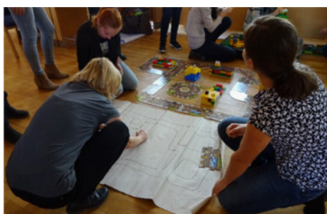
Seminář zaměřený na polytechnickou výchovu, říjen 2017, Moravská Třebová