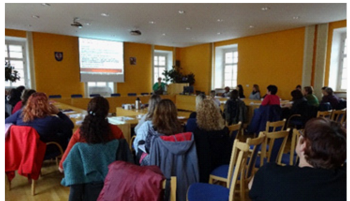
Seminář pro pedagogy MŠ „Plán pedagogického rozvoje pro děti s podpůrnými opatřeními“, říjen 2017, Moravská Třebová