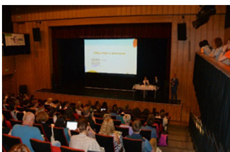
LeaderFest 2017, seminář Aktivita MAS v PRV