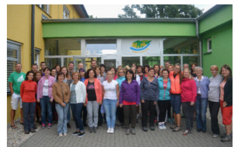
Exkurze pro pedagogy, září 2017, Svazková škola Údolí Desné