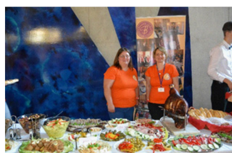
LeaderFest 2017, příprava pohoštění